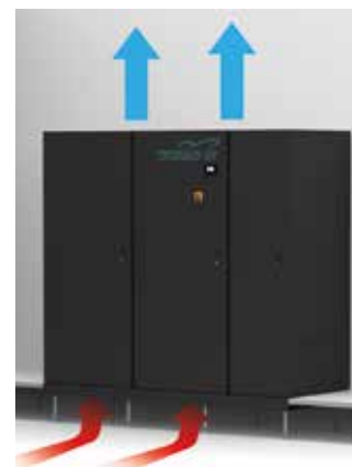
Ausführung mit Ansaugung von unten mit Sockel für Installationsboden, geschlossener Frontplatte und Luftauslass nach oben.