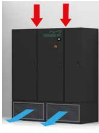
Ausführung mit Ansaugung von oben und frontalem Luftauslass mit Ausblasplenum mit ausrichtbaren Gittern.