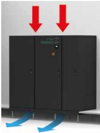
Standardausführung mit Ansaugung von oben und Luftauslass unten, mit Sockel für Installationsboden.