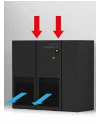
Ausführung mit Ansaugung von oben und frontalem Luftauslass mit Gitter-Frontplatte.