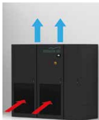
Standardversion mit frontalem Lufteinlass und Luftauslass nach oben.