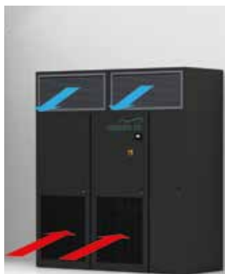
Ausführung mit frontalem Lufteinlass und frontalem Luftauslass mit Ausblasplenum mit ausrichtbaren Gittern.